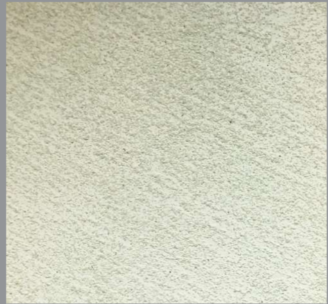
Col.041— 1Toner code 50411