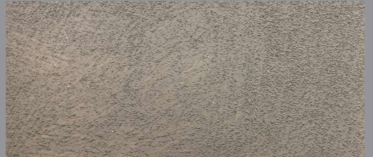
Col. 053 — 1Toner + Materia Diamonds code 50531MD