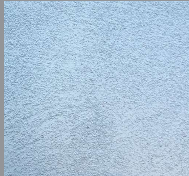
Col. 039 — 1Toner code 50391