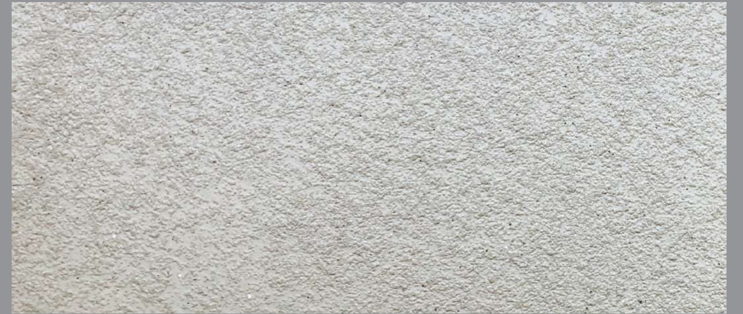
Col. 038— 1Toner + Materia Diamonds code 50381MD