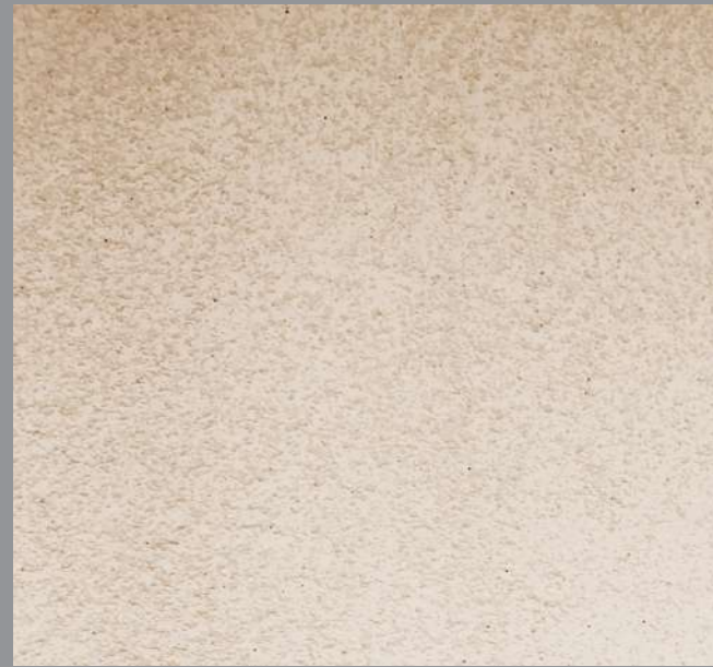
Col. 048— 1Toner code 50481