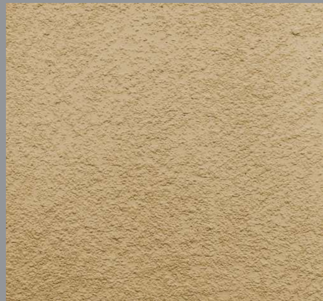
Col. 043 — 1Toner code 50431