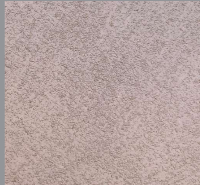
Col. 052— 1Toner code 50521