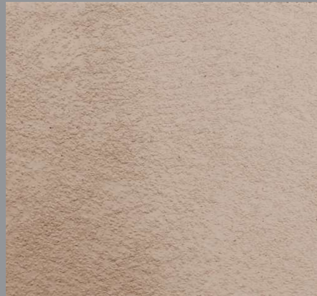
Col. 044 — 1Toner code 50441