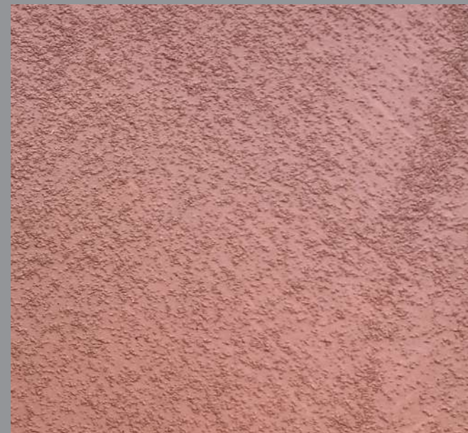
Col. 017 — 2Toner code 50172