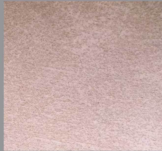
Col. 037— 1Toner code 50371