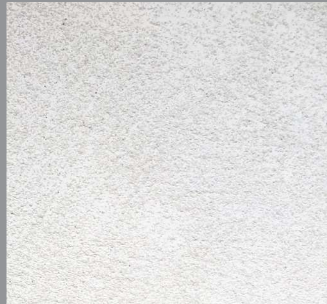
Col. 042— 1Toner code 50421