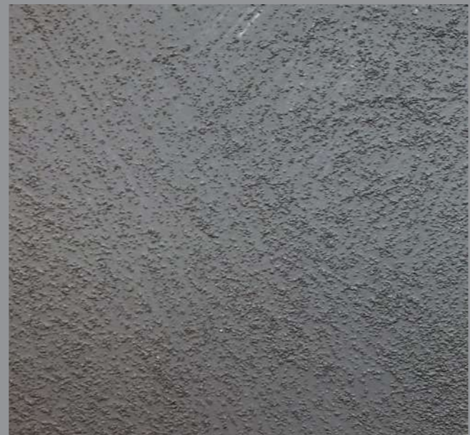
Col. BOLD 23 [008 - 2 toner + 014 - 1 toner] code 5B0LD23