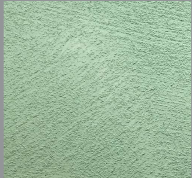
Col. 006 — 1Toner code 50061